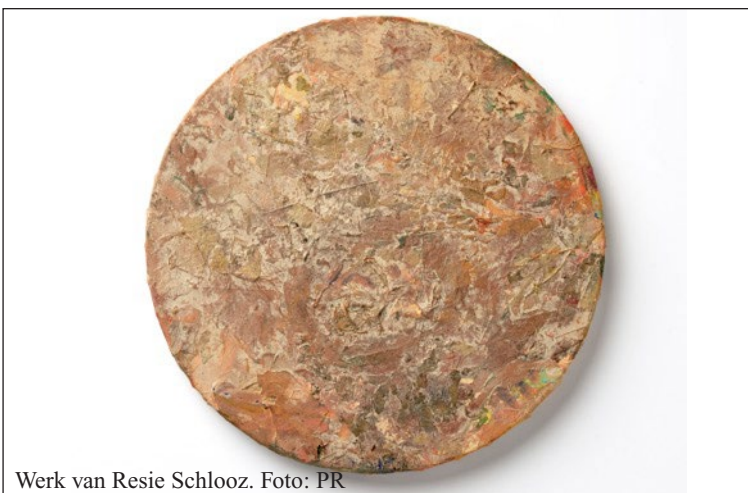
Werk van Resie Schlooz.

De expositie is te bezoeken iedere donderdag en vrijdag en de eerste en laatste zaterdag van de maand van 13.00 tot 17.00 uur, en op afspraak. Uitzondering is de vakantiesluiting van 30 juli tot 13 augustus. De Presentatiestudio is gehuisvest in het voormalige magazijn van Duikers, aan de 3 de Ambachtsschool in de Zwaardstraat 16, met eigen ingang vanaf de straat, iets verderop van de hoofdentree.