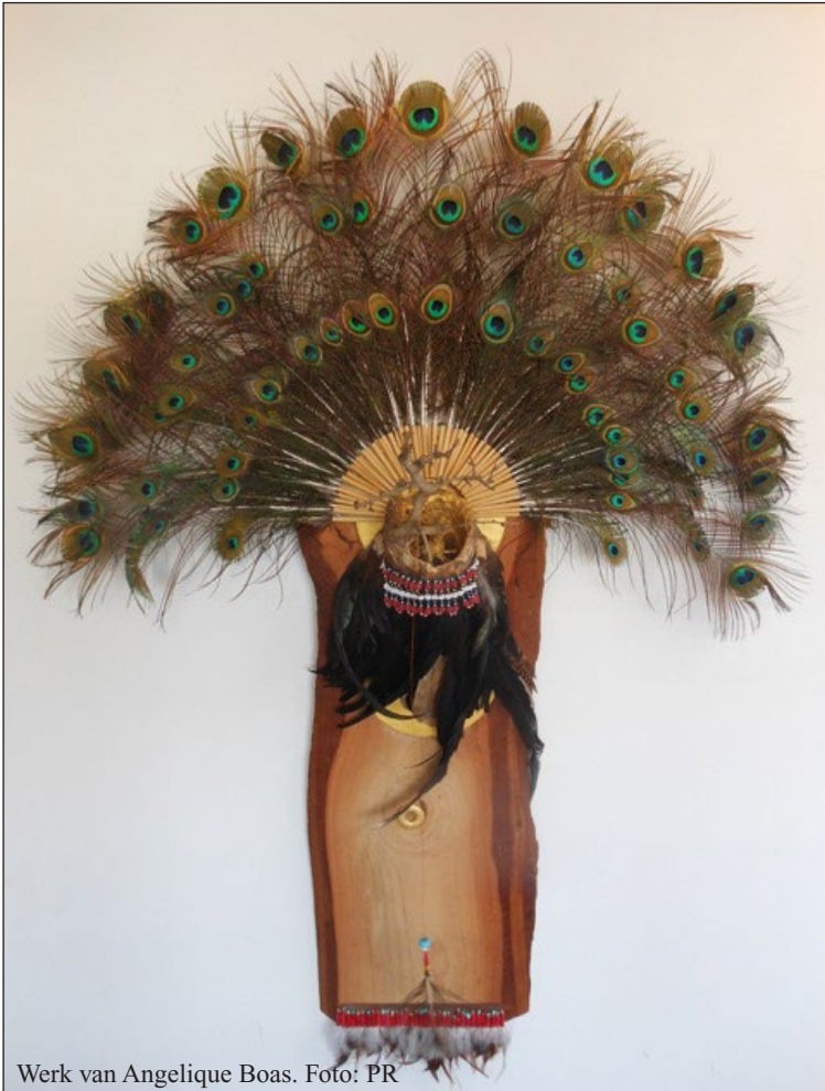
Werk van Angelique Boas.